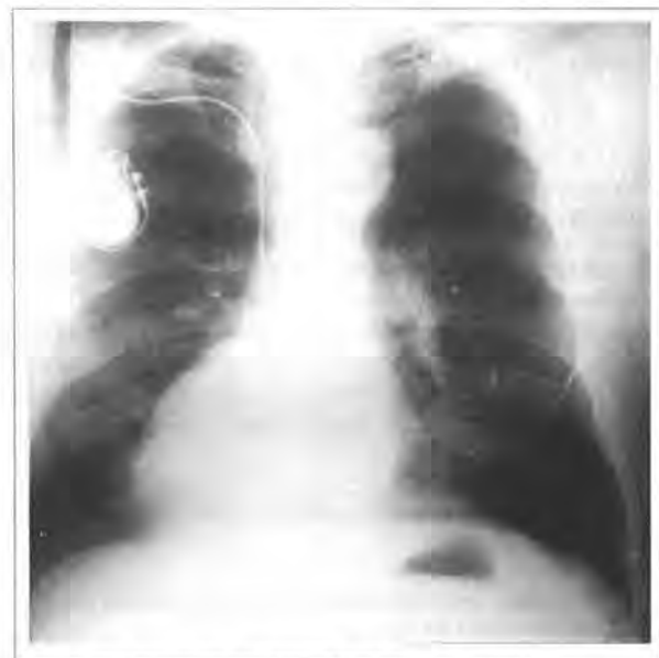
Figura 3 - Radiografia do tórax PA, pré-alta hospitalar.

Justifica-se o não emprego da estimulação