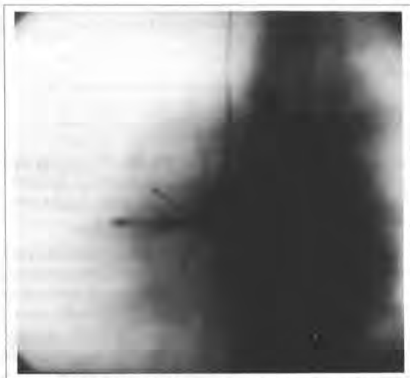
Figura 2 - Visão radioscópica dos cabos-eletrodos temporário e definitivo (ponto do V.D.).

HTD, foi retirado o cabo-eletrodo temporário com cuidado, sendo visualizado pela radioscopia.