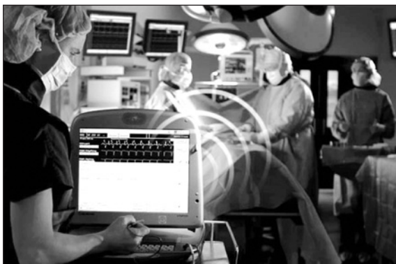
Figura 1 - No implante - Elimina a necessidade da cabeça de programação e mantém a telemetria durante todo o procedimento. Menor tempo e possibilidade de utilizar o analisador concomitante com o programador.

• ATP durante a carga: o dispositivo pode aplicar pulsos antitaquicardia (ATP) durante a carga para o choque de alta energia, visto que, na maioria