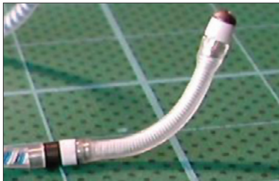
Figura 2 - Eletrodo bipolar Corox OTW BP.

Estudos recentes têm revelado que, em 80% dos pacientes, o nervo frênico esquerdo passa próximo às veias coronárias laterais e, nos outros 20%, localiza-se nas proximidades da via interventricular anterior, antes de alcançar o diafragma 5 . A estimulação frênica é, portanto, uma complicação relacionada com a localização anatômica individual do nervo frênico esquerdo em relação ao local escolhido para inserção do eletrodo de estimulação no ventrículo esquerdo 3 . O conflito anatômico entre a posição ótima para estimulação do ventrículo esquerdo e a estimulação inaceitável do nervo frênico pode levar ao insucesso alguns pacientes candidatos à TRC 3 .