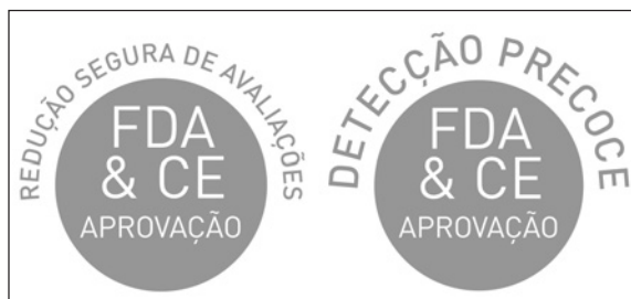
Figura 3 - Aprovado pela FDA e pela CE para detecção precoce e redução segura das avaliações.

O novo sistema de sinalização de tráfego do Home Monitoring Service Center permite acesso rápido e confiável dos dados do paciente e do dispositivo, assim como a detecção precoce e inteligente nas alterações do dispositivo, do status do paciente ou na fibrilação atrial assintomática.