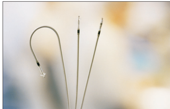
Figura 1 - Eletrodos Siello.