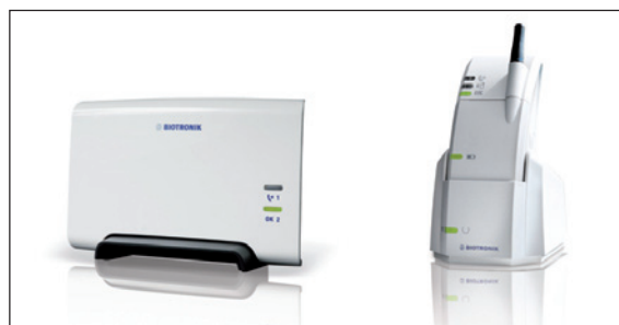
Figura 4 - CardioMessenger II-S e II.