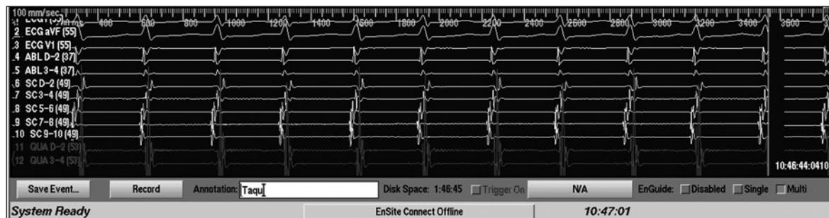
Figura 02: Registro da taquicardia supraventricular iniciada com a introdução de extraestímulos atriais cada vez mais precoces. Nota-se intervalo VA < 60 ms durante a taquicardia e ativação atrial retrógrada concêntrica.