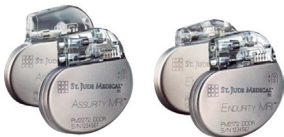
Figura 1: Assurity MRI™/Endurity MRI™.

As novas séries de marcapassos Assurity MRI™ e Endurity MRI™ (Figura 1) oferecem longevidade impressionante suportada por uma garantia estendida, tamanho reduzido com formato fisiológico (Figura 2) e compatibilidade com exames de ressonância magnética (RM) de 1,5 T, sem restrições de zona de exame ( Full-body ) e com alta energia (4 W/kg), bem como funções Premium .