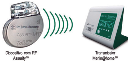
Figura 5: Assurity MRI & Merlin@home™.

Os marcapassos Assurity MRI™ possuem telemetria por RF e são compatíveis com o transmissor Merlin@home™ e com o sistema de monitoramento remoto Merlin.net PCN (Figura 5). O monitoramento remoto dos marcapassos é feito por meio da verificação diária de alertas, avaliação remota agendada e/ou interrogação iniciada pelo paciente.