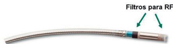
Figura 3: Tendril MRI™ - Filtros para RF.

O uso deste SAR maior deve-se às modificações do eletrodo Tendril MRI™ que possui dois filtros (Figura 3) para bloquear a entrada da radiofrequência de um scanner de 1,5 T, evitando que o calor seja dissipado da ponta do eletrodo para o miocárdio.