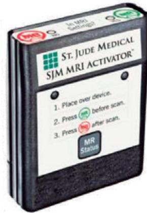
Figura 4: SJM MRI Activator.